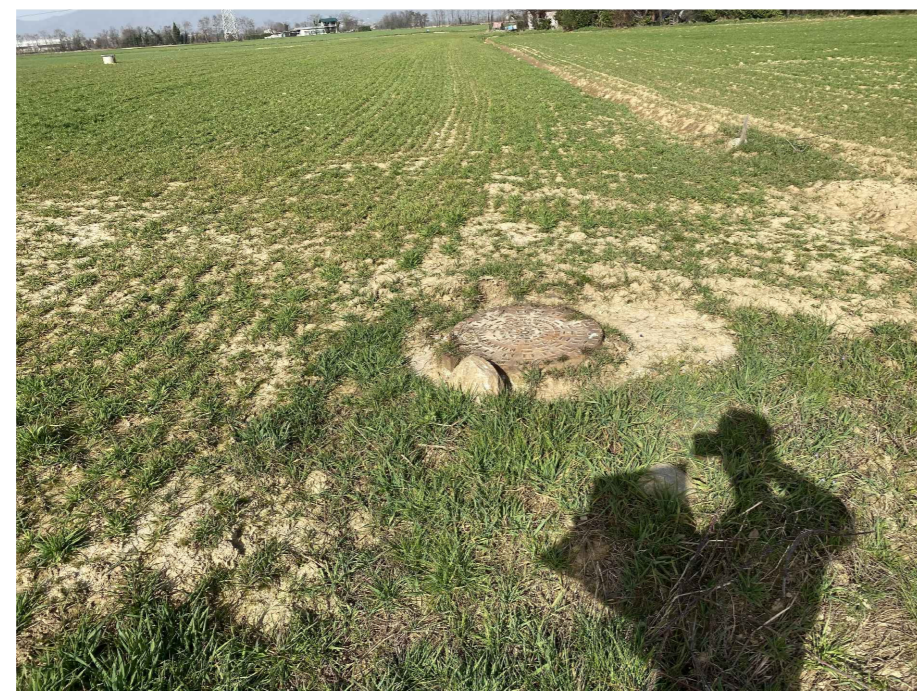
Ripresa fotografica 18