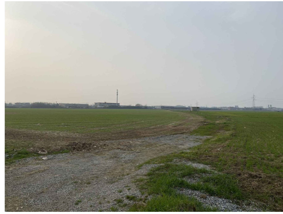
Ripresa fotografica 3