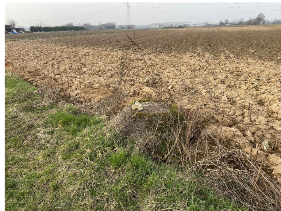
Ripresa fotografica 11