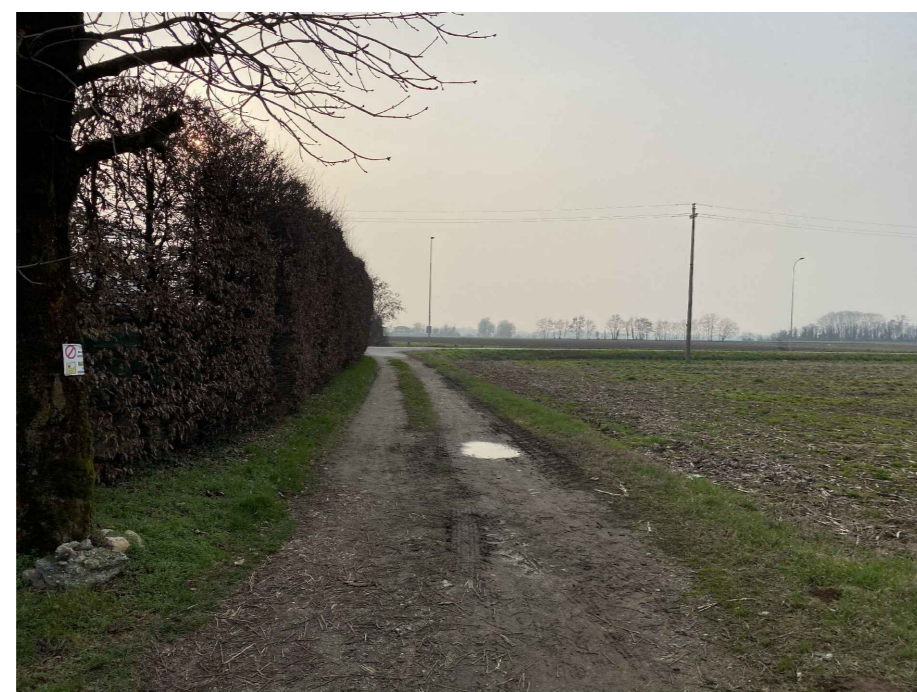
Ripresa fotografica 14