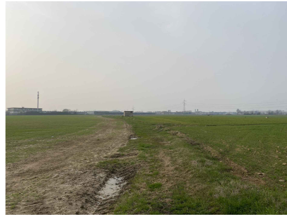
Ripresa fotografica 4