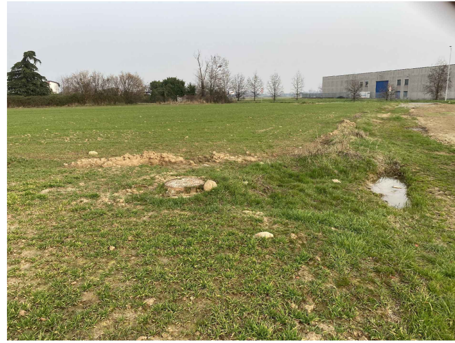
Ripresa fotografica 5