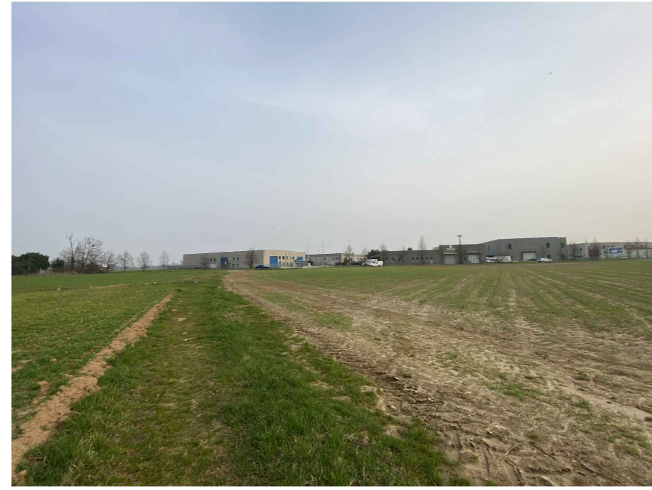
Ripresa fotografica 6