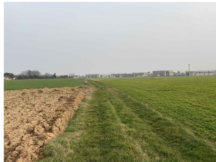
Ripresa fotografica 10