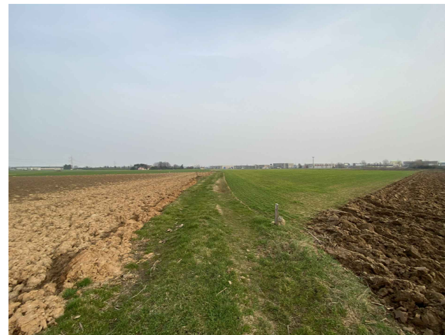
Ripresa fotografica 12