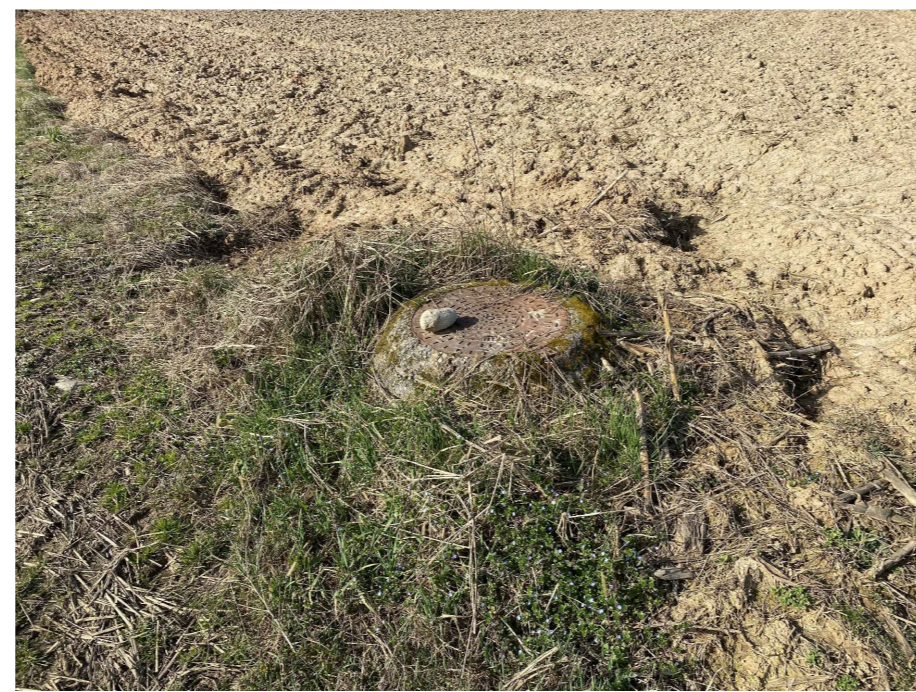
Ripresa fotografica 19