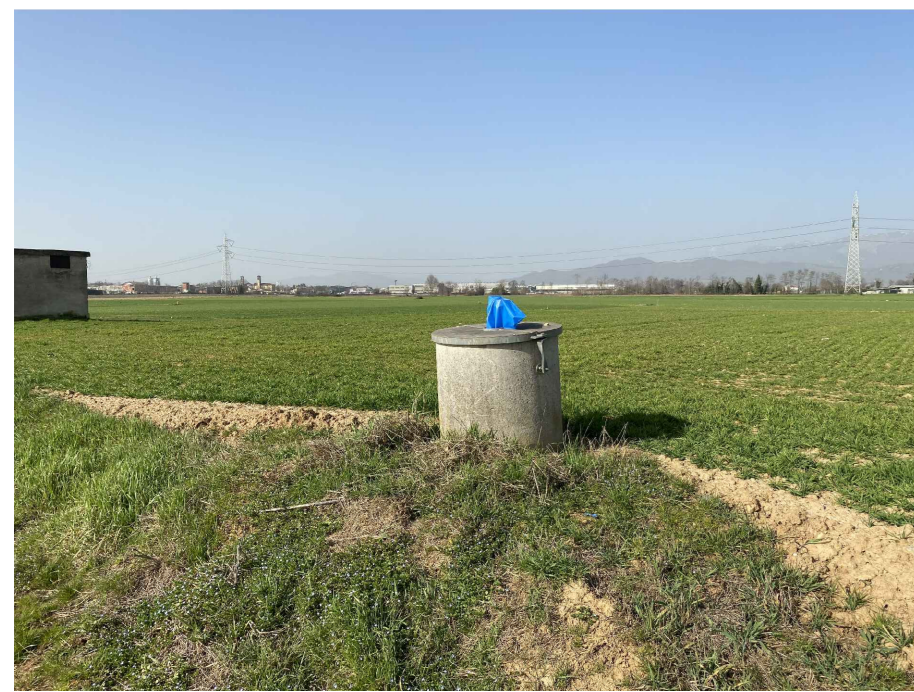
Ripresa fotografica 17