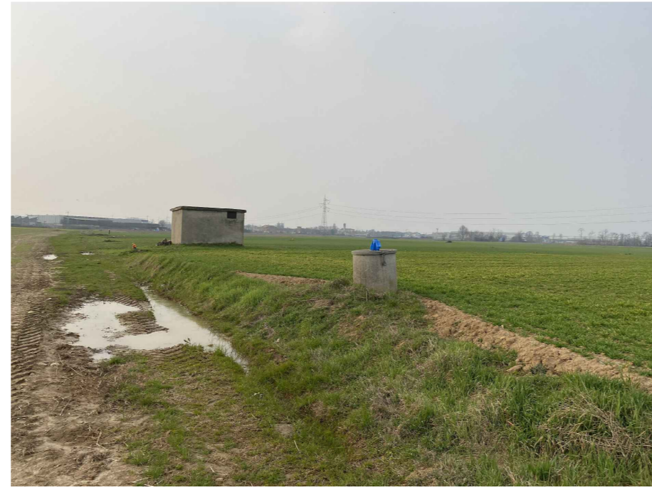
Ripresa fotografica 7