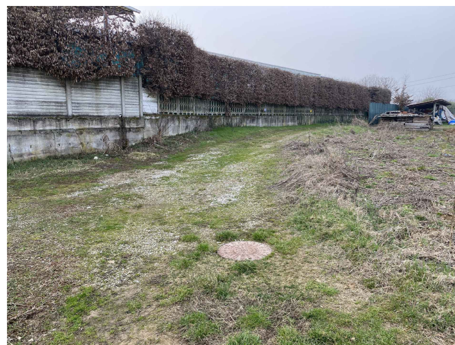
Ripresa fotografica 13