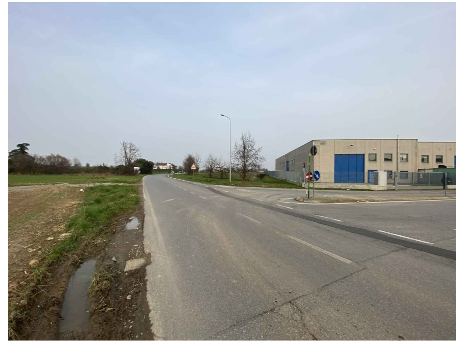
Ripresa fotografica 2