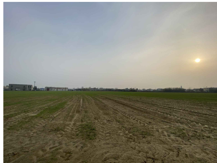
Ripresa fotografica 9