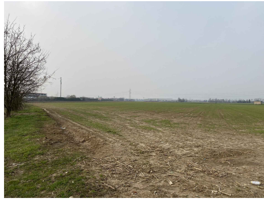
Ripresa fotografica 1