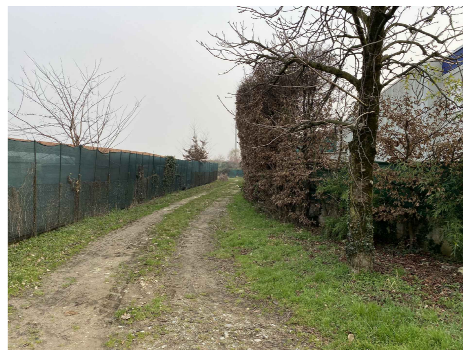
Ripresa fotografica 15