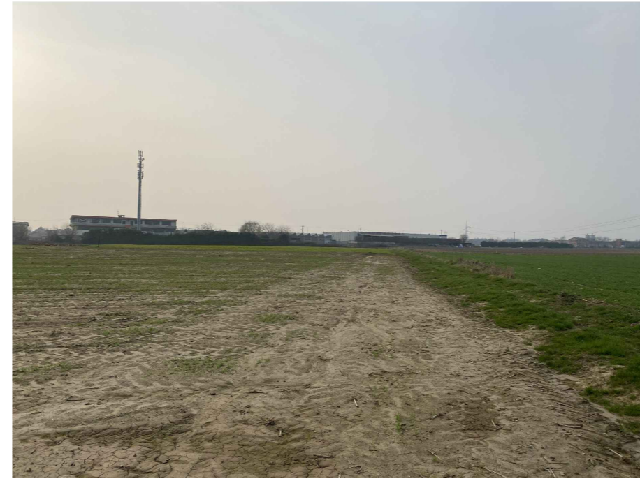
Ripresa fotografica 8