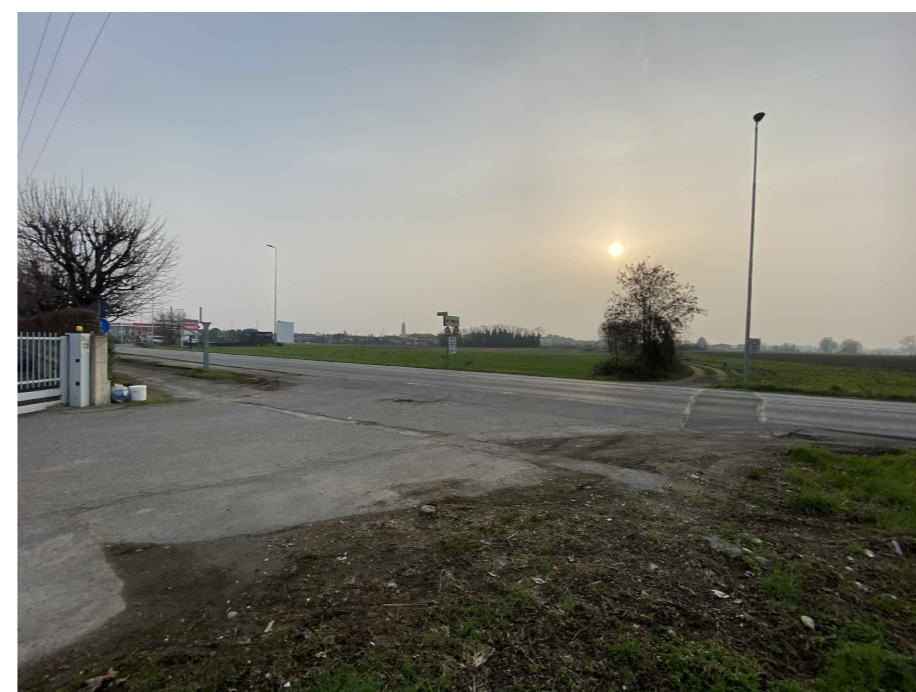
Ripresa fotografica 16