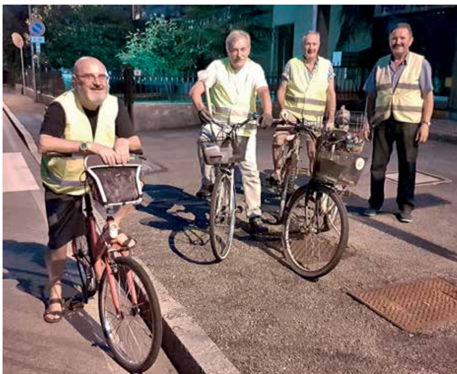
Alcuni dei volontari comunali alle prese con i trattamenti preventivi