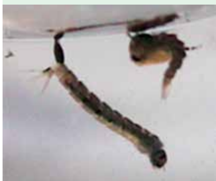
Larve di zanzare tigre

Quindi, come per le zanzare comuni, solo quando il fenomeno è trascurato (per inosservanza o per inadempienza) il problema può interessare interi quartieri e Comuni.