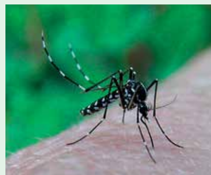
Zanzara tigre adulta

presenti sotto la soglia di molestia , con una costante attenzione alla salvaguardia dell'ambiente.