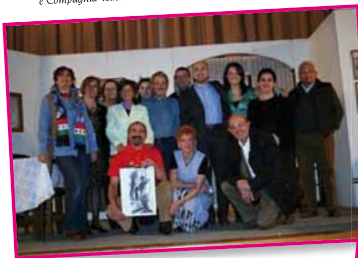
Compagnia Teatrale Cornatese di Cornate d'Adda e Compagnia Teatrale Oratoriale di Suisio