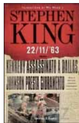
Stephen King "22/11/63"