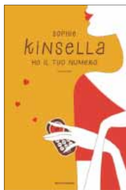
Sophie Kinsella "Ho il tuo numero"