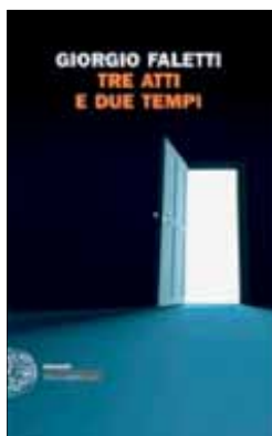
Giorgio Faletti "Tre atti e due tempi"