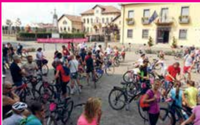
Pedalata per famiglie organizzata in occasione della "Bottanuco in Rosa"

Le manifestazioni organizzate dalle nostre associazioni sportive: