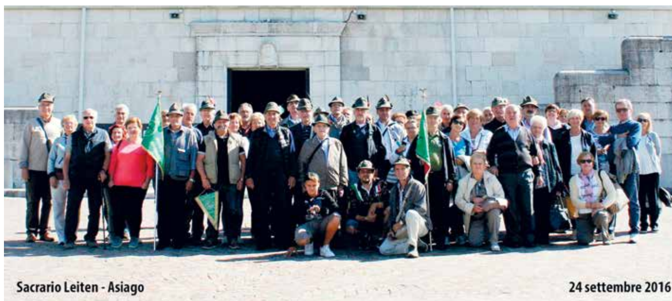
Sacrario Leiten - Asiago

Numerosa è stata la partecipazione del nostro Gruppo. Siamo stati ospitati in un capannone dismesso