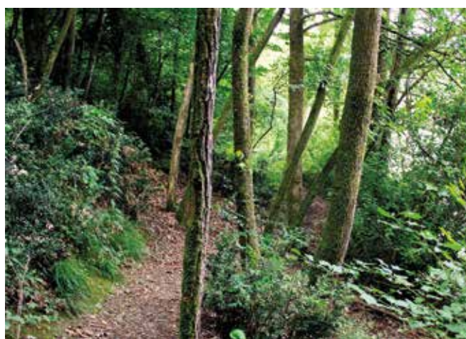
il sentiero a metà percorso