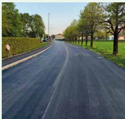
Riqualificazione via Kennedy