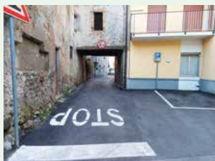
Asfaltatura via Chiesa

Anche l'anno 2021 è stato ricco di opere realizzate e di lavori conclusi: eccone alcuni nelle immagini sottostanti.