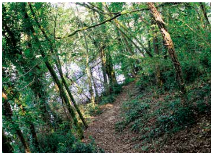
l'inizio dello stretto e tortuoso sentiero