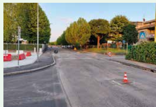
Riqualificazione via Papa Giovanni XXIII