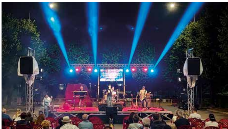
Festival Sotto i Tigli 2021