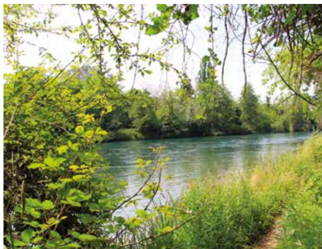
una veduta del fiume lungo il sentiero