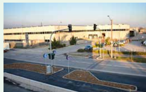
Nuovo attraversamento pedonale semaforizzato sulla SP170 (Via De Gasperi – Via San Michele)