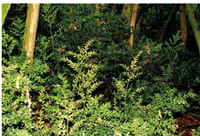
distese di Pungitopo nel folto sottobosco