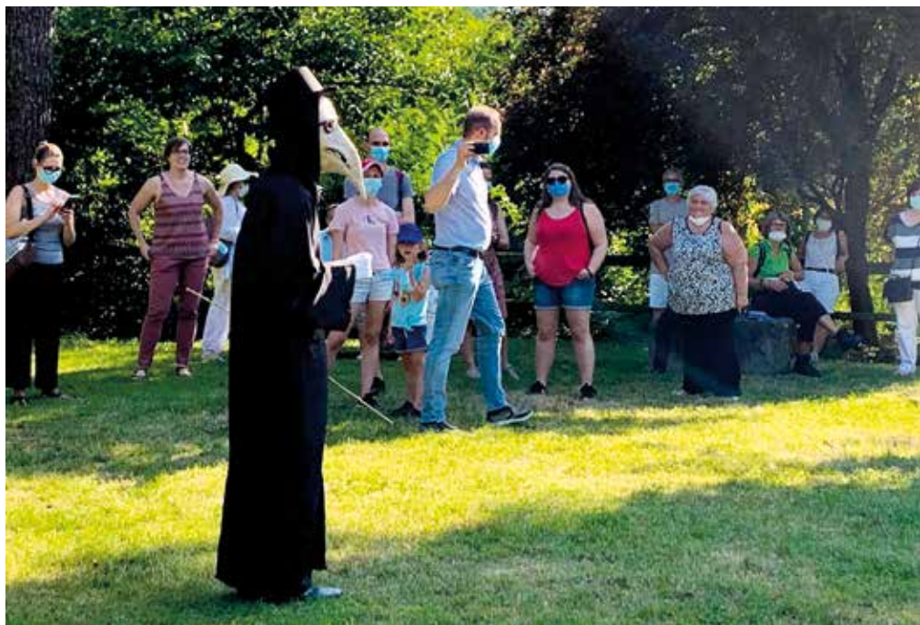
Le emozioni dei nostri bei luoghi