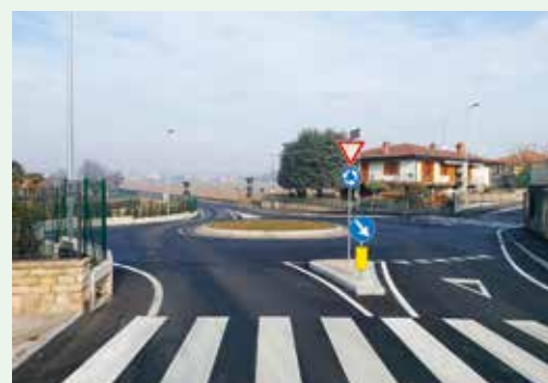
Realizzazione nuova rotonda via Manzoni/Pellico