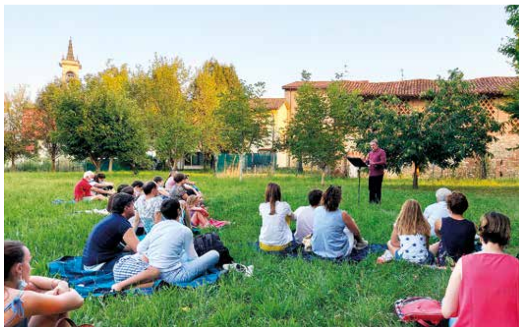
11.09.2021: Letture dalla Divina Commedia al Parco Moretti per i 700 anni dalla morte di Dante Alighieri