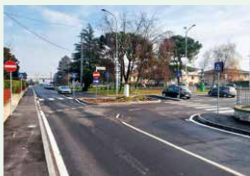
Riqualificazione vie De Gasperi, Mazzini, Kolbe, Dante Alighieri