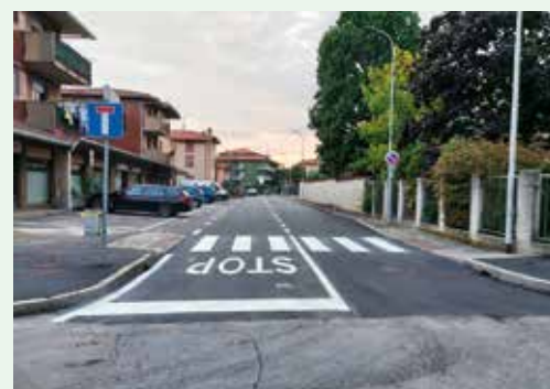
Riqualificazione Vicolo San Carlo