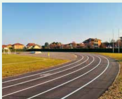
Riqualificazione pista di atletica