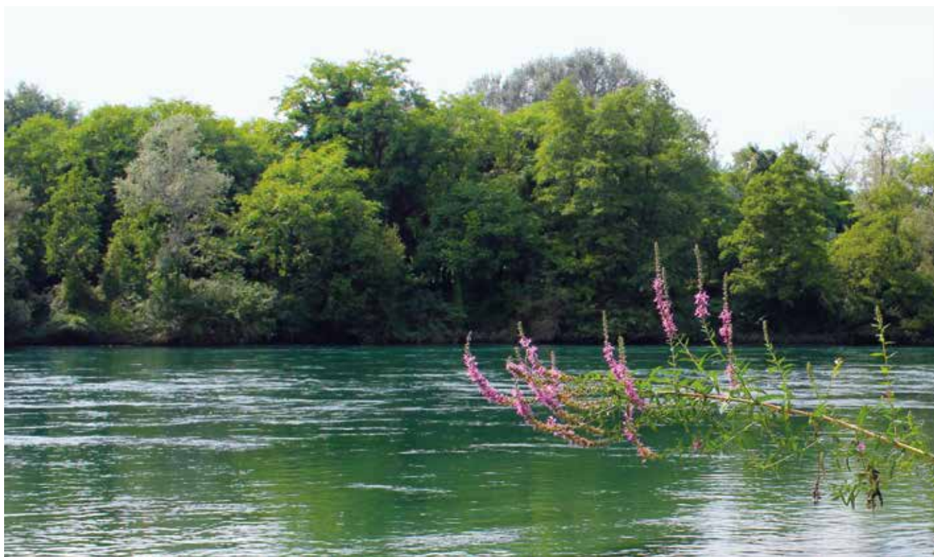
Salcerella radente le acque del fiume