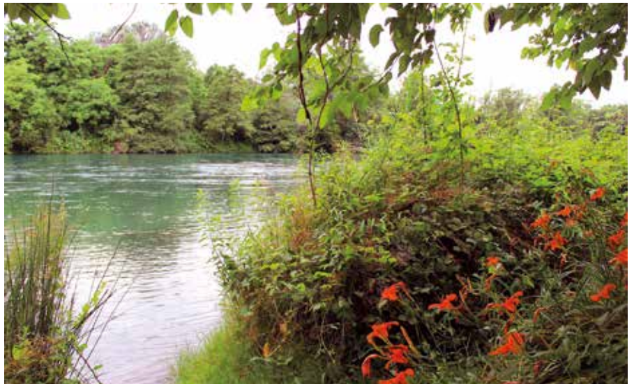
Gigli rossi di San Giuseppe nel breve tratto terminale del sentiero alla fine di giugno

In una delle mie prime escursioni che ho effettuato appena arrivato, sette anni fa, nel nostro (mio nuovo) Comune di residenza, inserito per cinque Km nel Parco Adda Nord, ho "scoperto" questo piccolo luogo incantevole ed accattivante. Risalendo il corso del fiume che conoscevo bene da sempre (solo, però, da Fara a Castelnuovo Bocca d'Adda, dove confluisce nel grande Po), al termine di un breve sentiero, mi sono trovato davanti questo rustico tavolo con relative due panche e una staccionata di legno resistente trattato in autoclave. Una volta seduto su quella fronte fiume, ho guardato e ammirato il colore delle sue acque (che a seconda del tempo e della stagione variano dal blu scuro al turchese, dal verde smeraldo all'azzurro) ed ho subito sentito la musica del loro scorrere più o meno veloce, raramente impetuoso. Il tutto immerso nella folta vegetazione di piante erbacee, arbustive ed arboree, soprattutto gelsi, che ogni tanto lasciavano cadere more nere giunte al termine della loro maturazione. L'ho definito: "il (mio) Salottino ". Definizione banale, infantile? Può essere, ma non per me: io in questo luogo isolato, fresco e profumato, ogni anno ho trovato (e vorrei continuare a trovare) momenti importanti di tranquillità, serenità e pace, in solitario contatto con la Natura dove, oltre