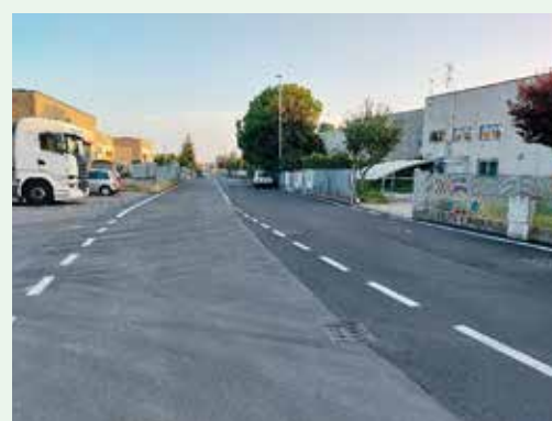
Riqualificazione via Vienna