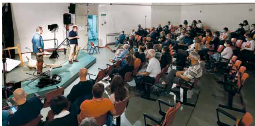
02.10.2021 Terre di Mezzo