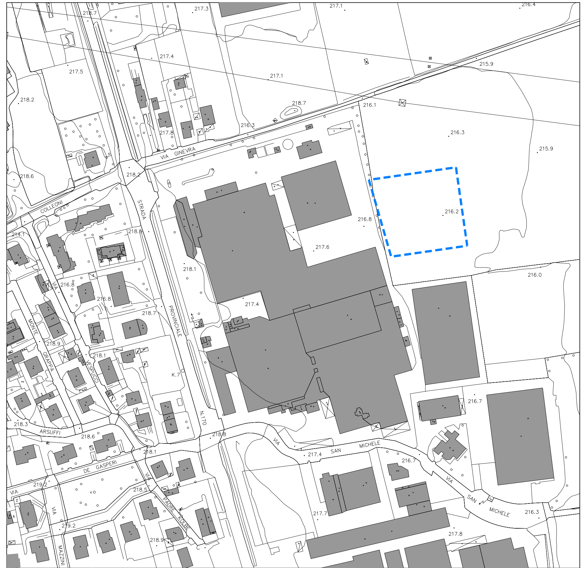
ESTRATTO AEROFOTOGRAMMETRICO - scala 1:2.000