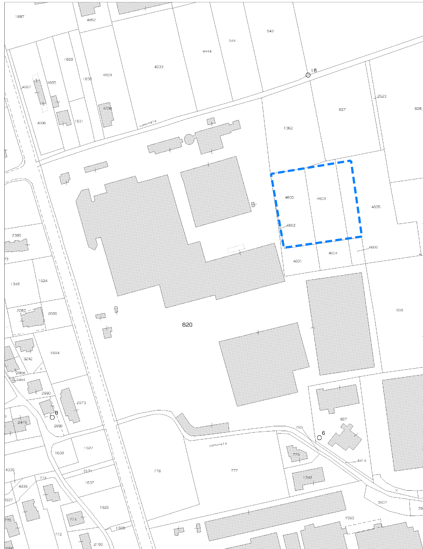
ESTRATTO MAPPA CATASTALE - scala 1:2.000