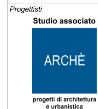
Tavola DP 04|01