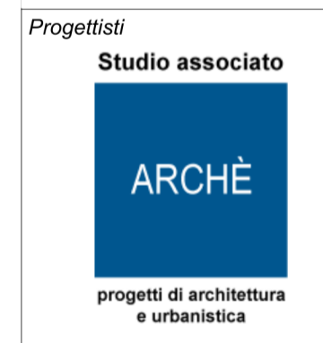
Tavola PR 01|02g

Gruppo di lavoro Studio associato ARCHÈ arch. Franco Resnati - arch. Fabio Massimo Saldini arch. Paolo Dell'Orto plan. Giorgio Limonta